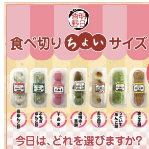
ちょいシリーズの投稿