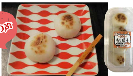
ちよい炙り団子(みたらし)