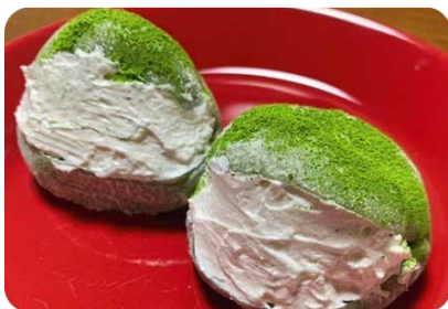
マリトッツォあんこ餅