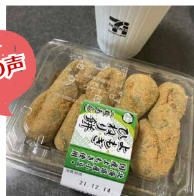
よもぎひねり餅(粒あん)