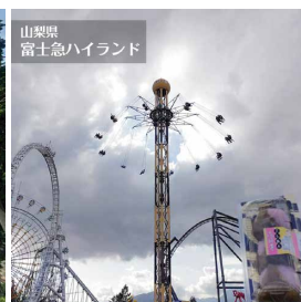
山梨県 富士急ハイランド