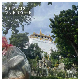
タイ バangkok ワットサゲート

そこで、2022年はちょっとした「お出かけ」や「旅」に和菓子 を持ってお出かけしてもらいたいとの願いを込めて、お出かけ支援 SNSアカウント【ちよい食べ明日香野】をスタートいたします。 明日香野和菓子にこだわらず、スーパーでの菓子などの購買意欲を 促進させられればと考えています。