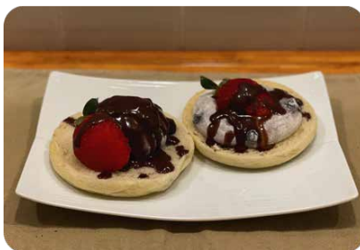
チョコレートあんこ餅