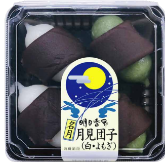
名月月見団子(白・よもぎ)